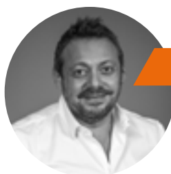
Table ronde : « Pourquoi le digital a un impact structurel et organisationnel sur les professions du droit ? Quel impact sur le travail collaboratif ? »